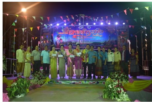
โครงการประเพณีลอยกระทง