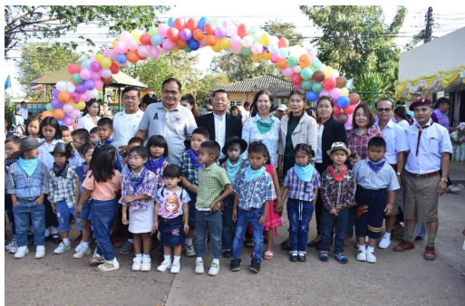
โครงการวันเด็กแห่งชาติ