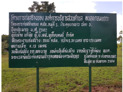
ก่อสร้างถนน คสล.ม.3 คุยนางขาว ซอย 5