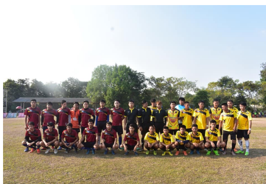
โครงการแข่งขันกีฬาต้านยาเสพติด