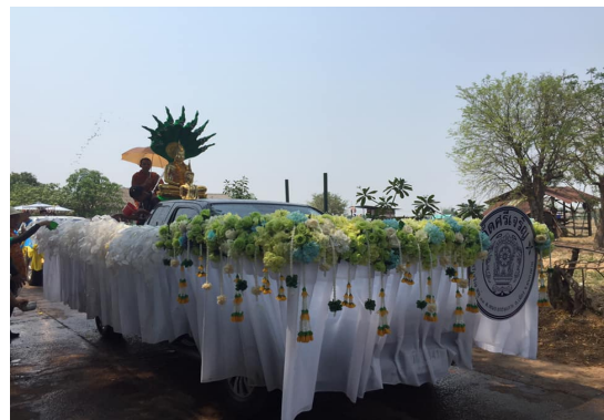
อุดหนุนคณะกรรมการหมู่บ้าน (สงกรานต์)