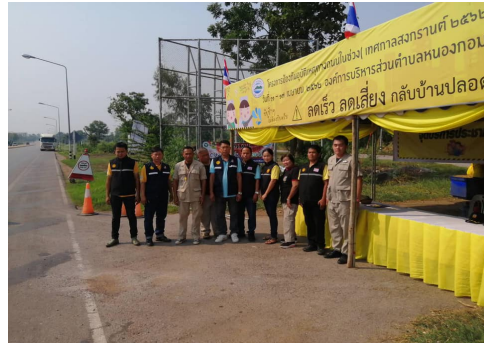
โครงการป้องกันและลดอุบัติเหตุช่วงเทศกาล