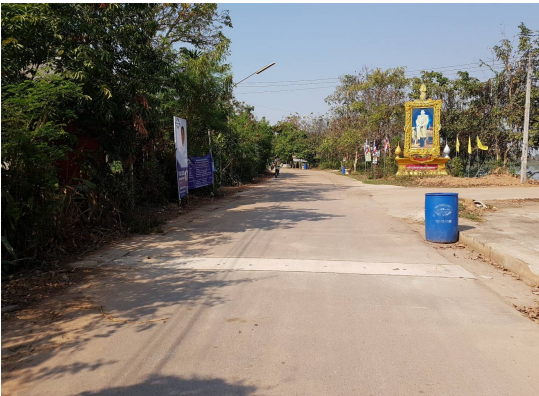
ก่อสร้างถนน คสล.ภายในตำบลหนองกอมเกาะ ม8 ซอยแจ้งสว่าง5/3