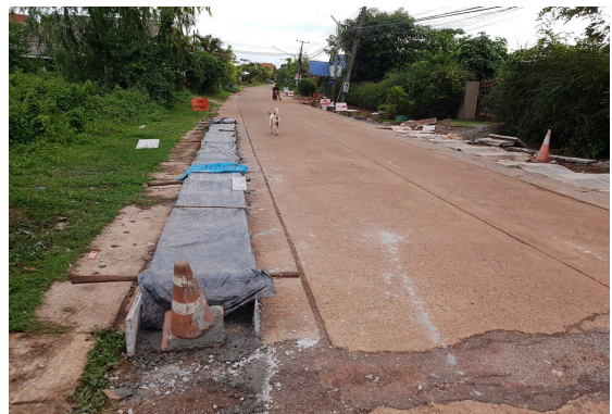
ก่อสร้างรางระบาย คสล.12 ซอยนาไก่ 1ไปซอยนาไก่3

รายงานผลการติดตามและประเมินผลแผนพัฒนาขององค์การบริหารส่วนตำบลหนองกอมเกาะ ประจำปีงบประมาณ พ.ศ. ๒๕๖๒ (ระหว่างเดือนตุลาคม พ.ศ. ๒๕๖๑ ถึง เดือนกันยายน พ.ศ. ๒๕๖๒)