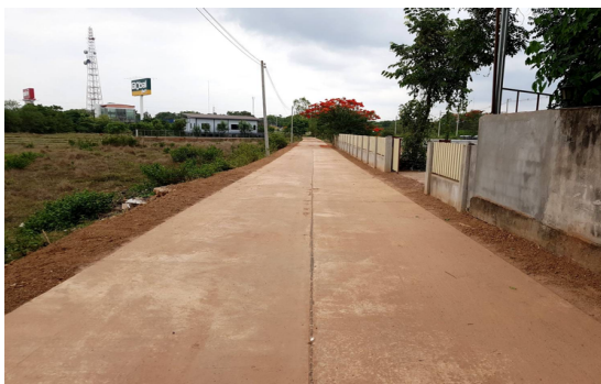
ตามและประเมินผล