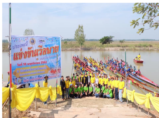
โครงการแข่งขันเรือพาย