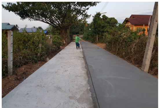
ก่อสร้างถนน คสล.ม.3 ซอย 2