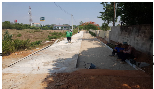
พ.ศ. ๒๕๖๒ พ.ศ. ๒๕๖๒