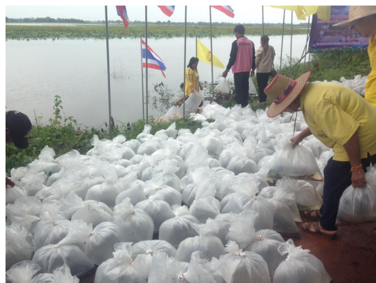
โครงการปล่อยพันธุ์ปลาฯ