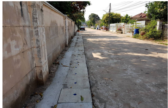
ก่อสร้างรางระบาย คสล.ม.12 ซอยนฤมล 1