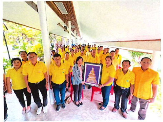
เบ็ยยังชีพผู้สูงอายุ