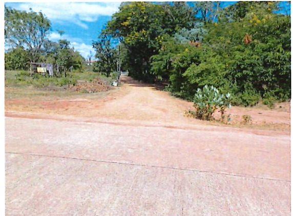
โครงการก่อสร้างถนน คสล. หมู่ที่ 11 (ซอยบ้านน้อย 8) รหัสสายทาง นค.ถ.115 - 088