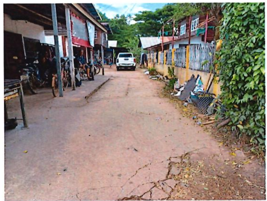
โครงการก่อสร้างถนน คสล. หมู่ที่ 7 (ซอยหนองเดิน 8/1) รหัสสายทาง นค.ถ.115 - 095