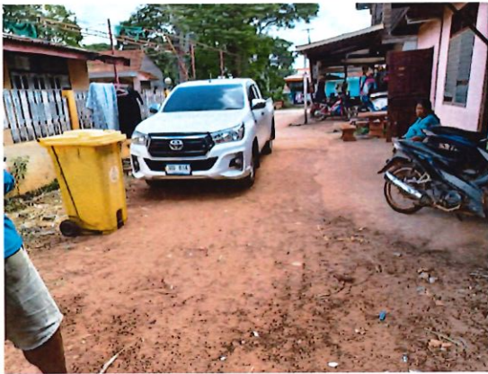
โครงการก่อสร้างถนน คสล. หมู่ที่ 4 (ซอยนาเหลาทอง 1/1.1)